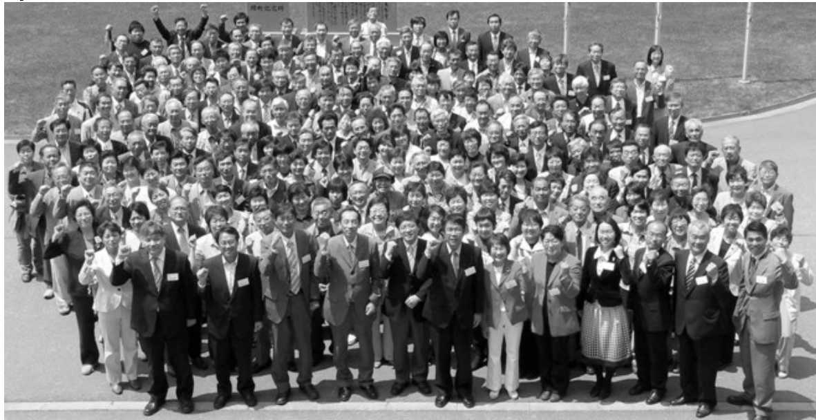
会場前での記念写真 中央前が井上議員、山口候補。上越市議員団は左側2～3列目

去る17日に行われた「日本共産党北陸信越地方議員研修会」には、長野・富山・石川・福井・新潟各県から230名を超える地方議員が一堂に会し、「山口のりひさを一回で国会への誓いを新たにしました。」 記念講演を行った井上さとし参議院議員は、「福田内閣は問題解決能力がなく、支持率も急落している。公明党も深刻な矛盾を抱え、地方紙で『のたうちまわる公明党』と評されている。こうした中、いつ解散総選挙になっても不思議ではなく、今がまさに正念場だ。全国で『綱領と当面の熱い課題』に取り組み日本共産党が注目されている。朝日新聞が『後期高齢者医療