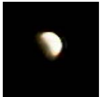
2000年7月16日の月食 Canon PowerShot A5 Zoom 2倍